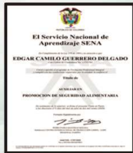
Diploma Auxiliar en Seguridad Alimentaria

Es satisfactorio compartir con la comunidad hospitalaria el logro académico obtenido en alianza con el Servicio Nacional de Aprendizaje SENA, de seis pacientes (3 usuarios del programa Hospital Día general y 3 usuarios del programa de Resocialización del paciente Inimputable) y cuatro colaboradores, al culminar la etapa teórica y productiva del proceso académico en Promoción de Seguridad Alimentaria durante seis meses. Estos logros nos comprometen a seguir trabajando en la construcción de espacios para la inclusión social y educativa de nuestros usuarios, así como la desestigmatización de la enfermedad mental. El propósito de estas alianzas intersectoriales es potencializar en nuestros usuarios el desempeño de un rol ocupacional productivo que posibilite el acceso a las oportunidades laborales que ofrece el contexto y así impactar en su calidad de vida personal, familiar y social.