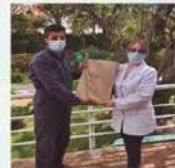
Taller de empaque